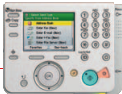
L'ampio display TFT a colori da 3,5 pollici con ghiera Easy-Scroll permette di accedere comodamente a tutte le funzioni.

Programmi di installazione guidata e di risoluzione dei problemi assicurano sempre il corretto funzionamento dell'apparecchio, evitando complicazioni.